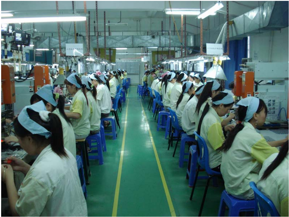
2F巻線/組立工程全景