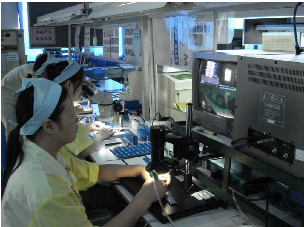
4F 時計コイル外観工程全景