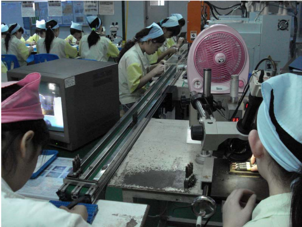
4F 時計コイル巻線工程全景